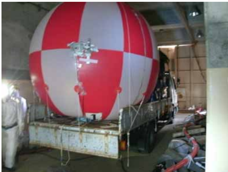
バルーントラック積載状況