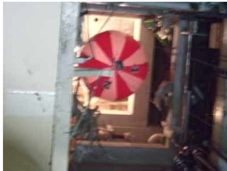
バルーン機器ハッチシャフト内浮遊状況 （真上を見上げた画像）