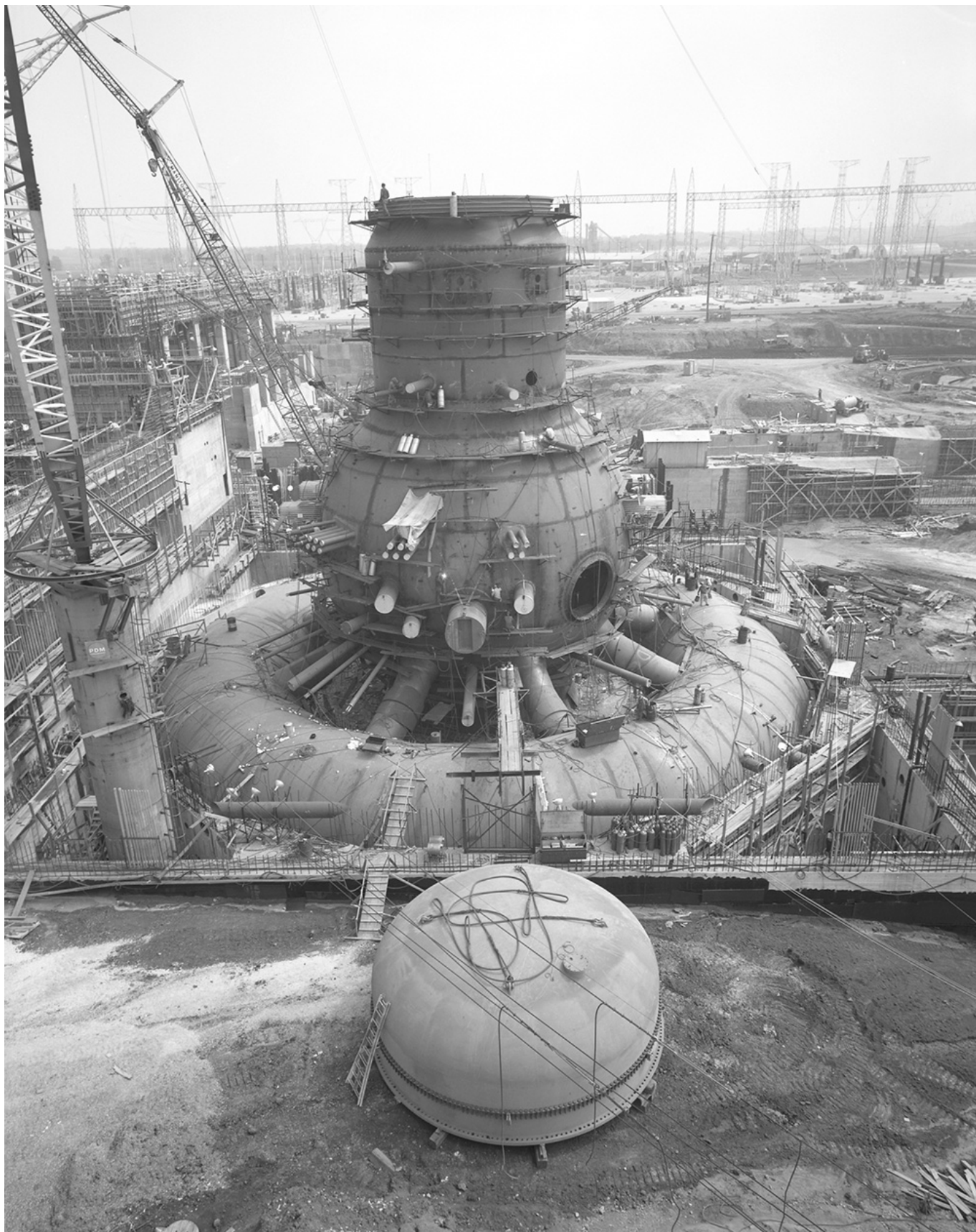
1F・1号機で使用されている原子炉格納容器（GE製 MARK1）と同型実物写真