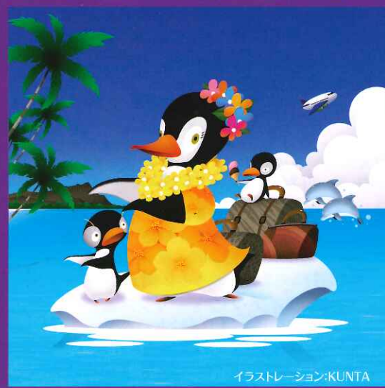
イラストレーション:KUNTA