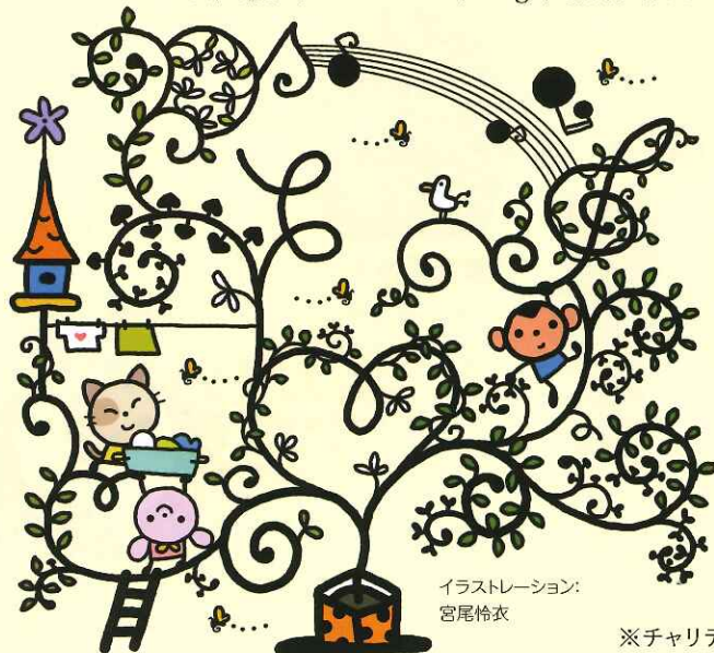
イラストレーション: 宮尾怜衣